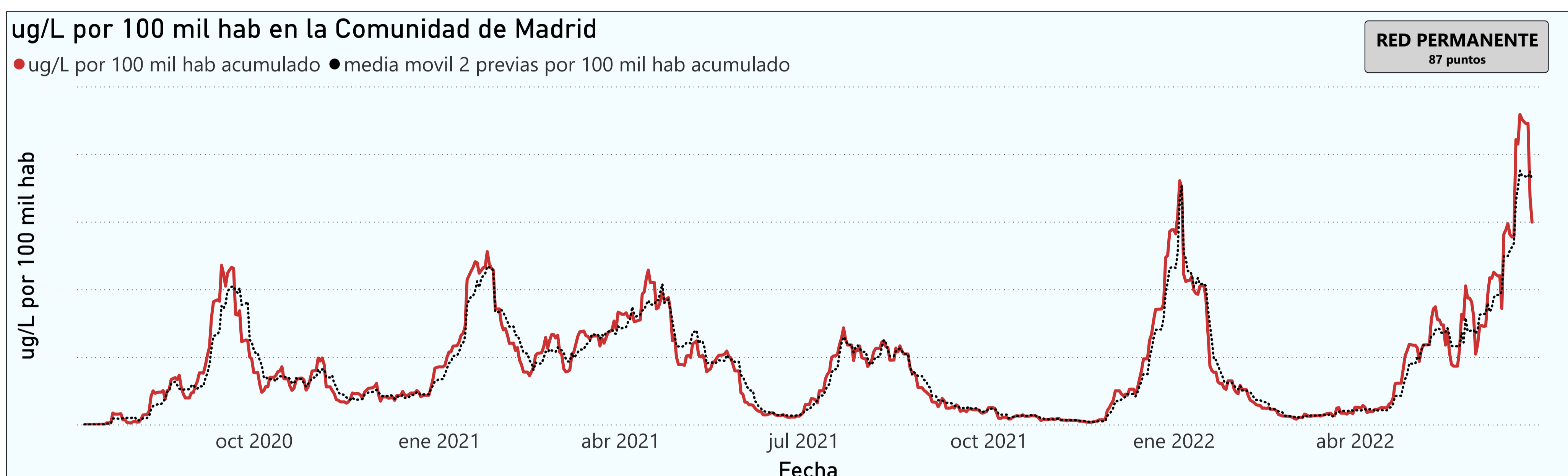
Gráfico 1. Evolución general de la Comunidad de Madrid

*En periodos de lluvia los resultados en el agua residual pueden verse afectados por la dilución de las aguas.