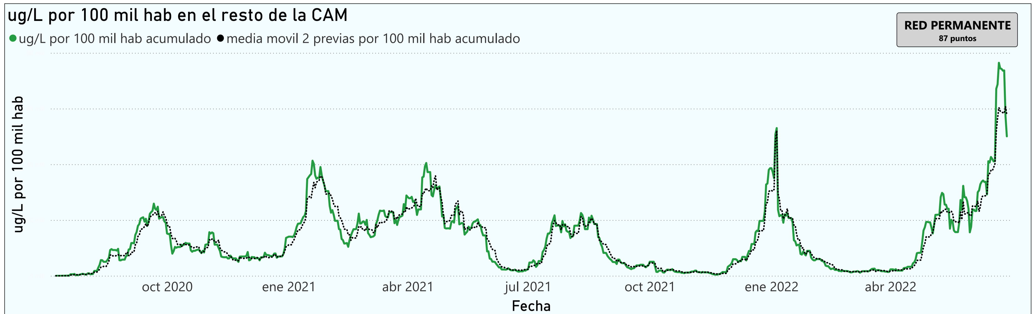
Gráfico 3. Evolución general de la Comunidad de Madrid, excluyendo la capital