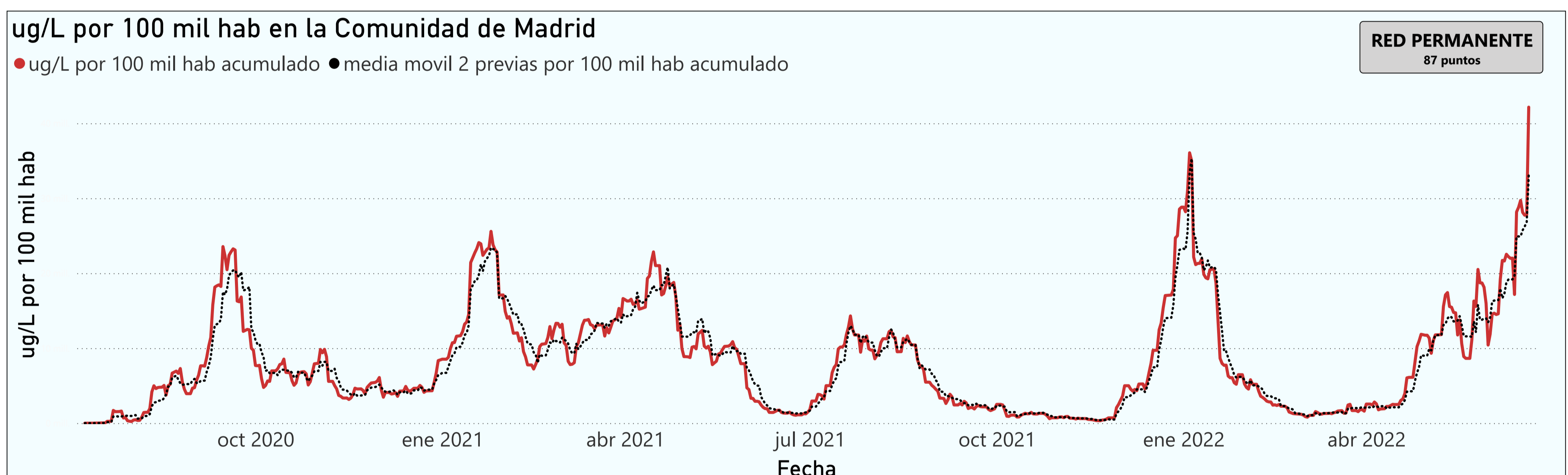
Gráfico 1. Evolución general de la Comunidad de Madrid

*En periodos de lluvia los resultados en el agua residual pueden verse afectados por la dilución de las aguas.