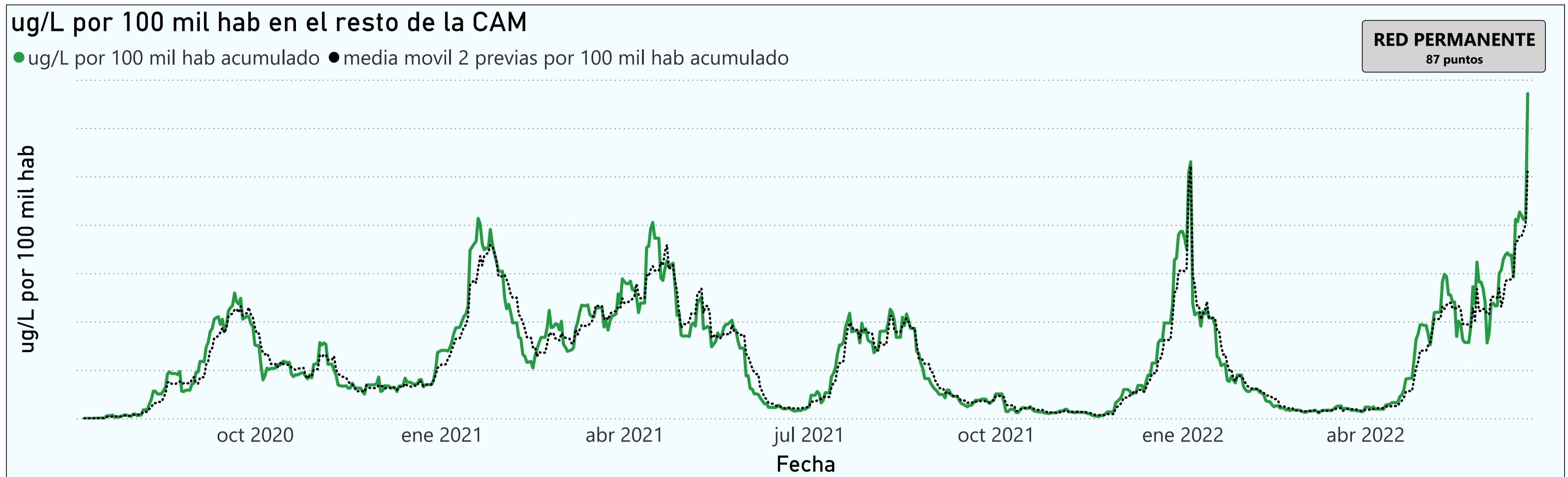
Gráfico 3. Evolución general de la Comunidad de Madrid, excluyendo la capital