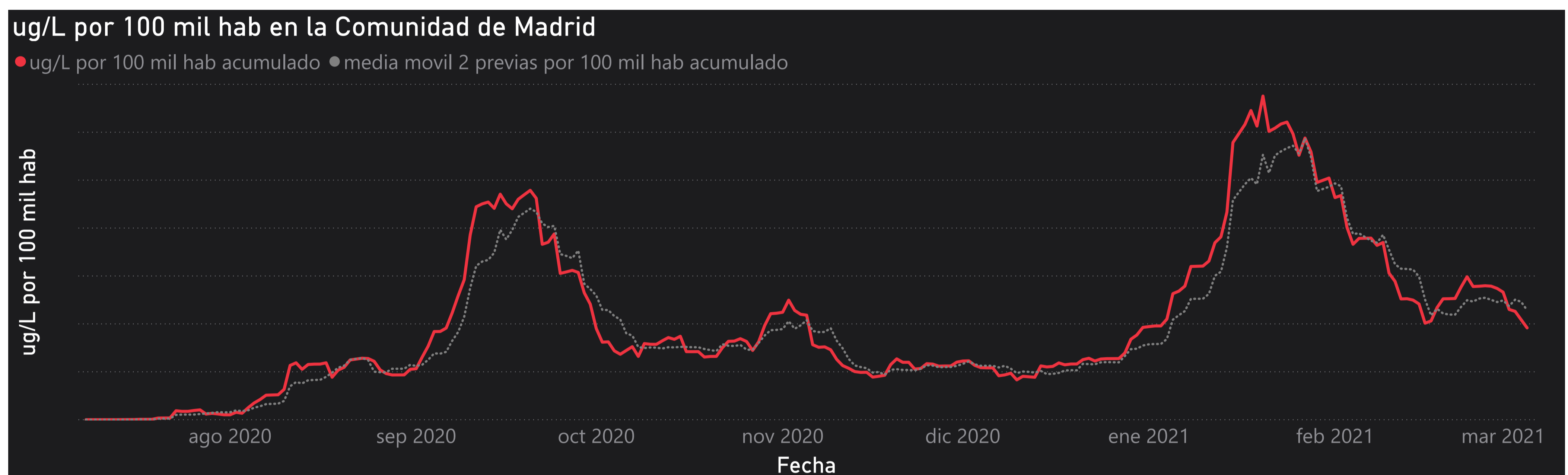
Gráfico 1. Evolución general de la Comunidad de Madrid