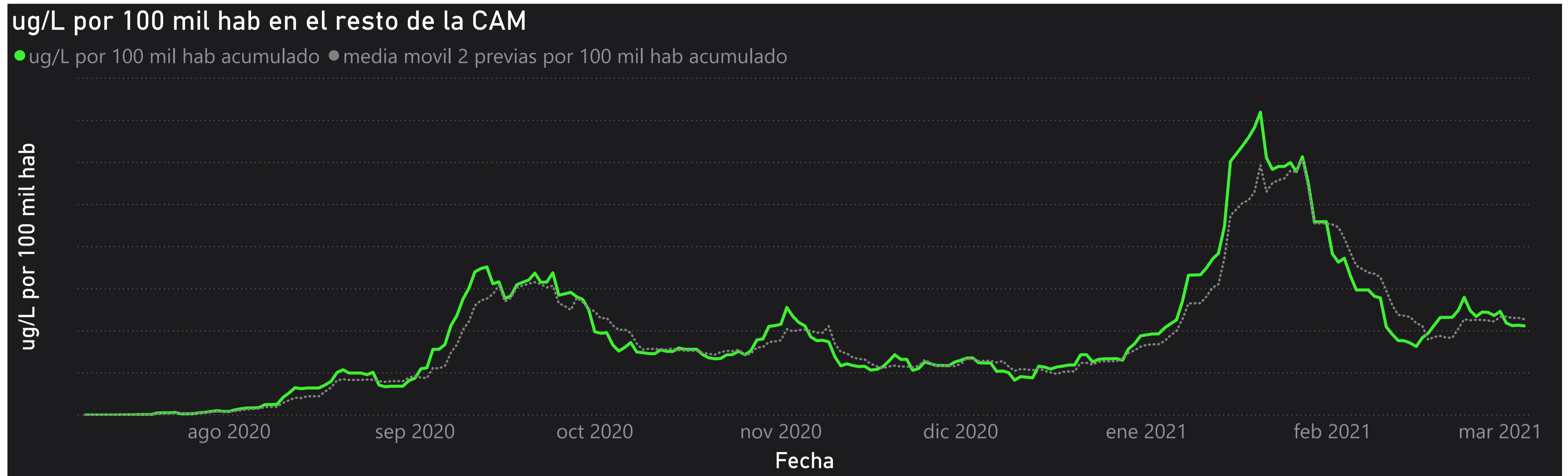
Gráfico 3. Evolución general de la Comunidad de Madrid, excluyendo la capital