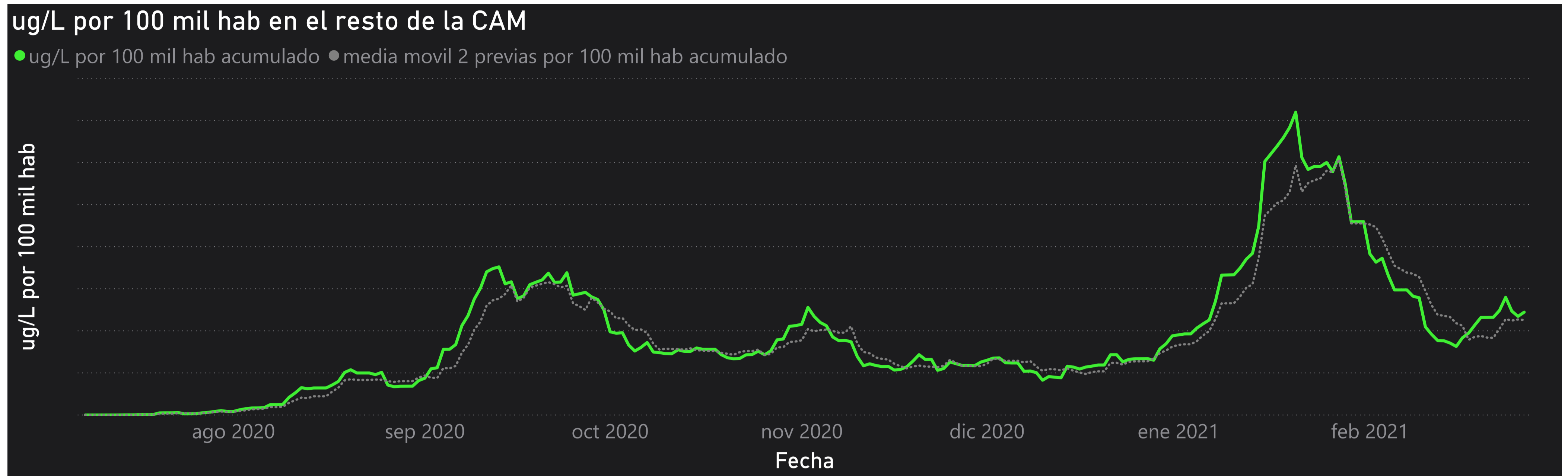
Gráfico 3. Evolución general de la Comunidad de Madrid, excluyendo la capital