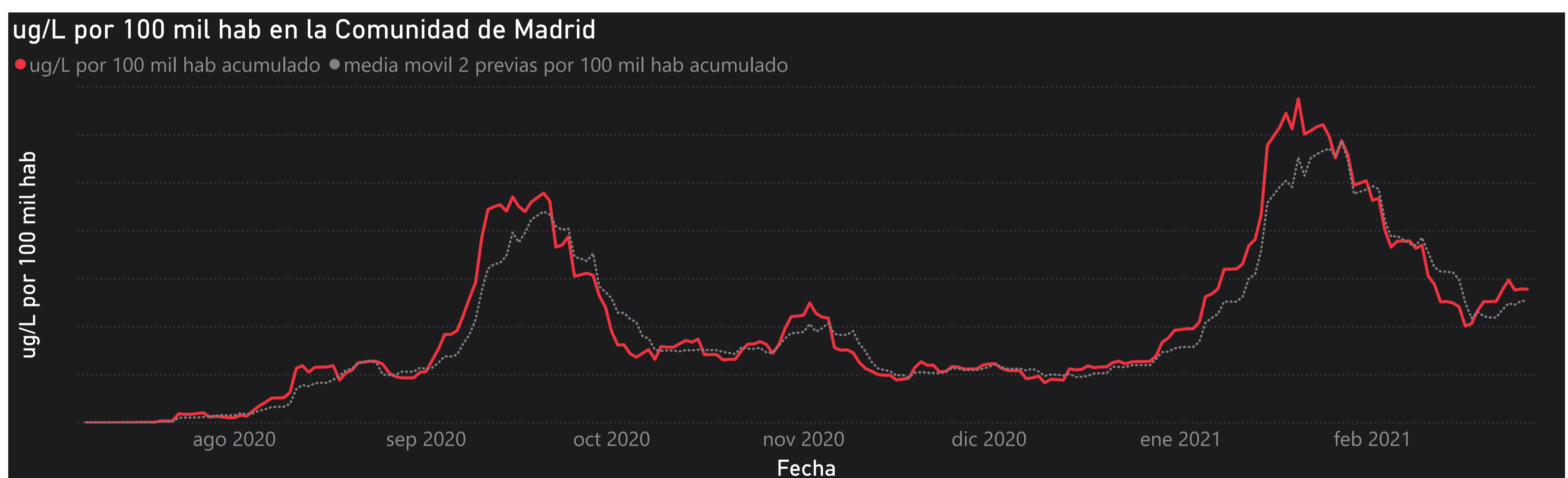
Gráfico 1. Evolución general de la Comunidad de Madrid