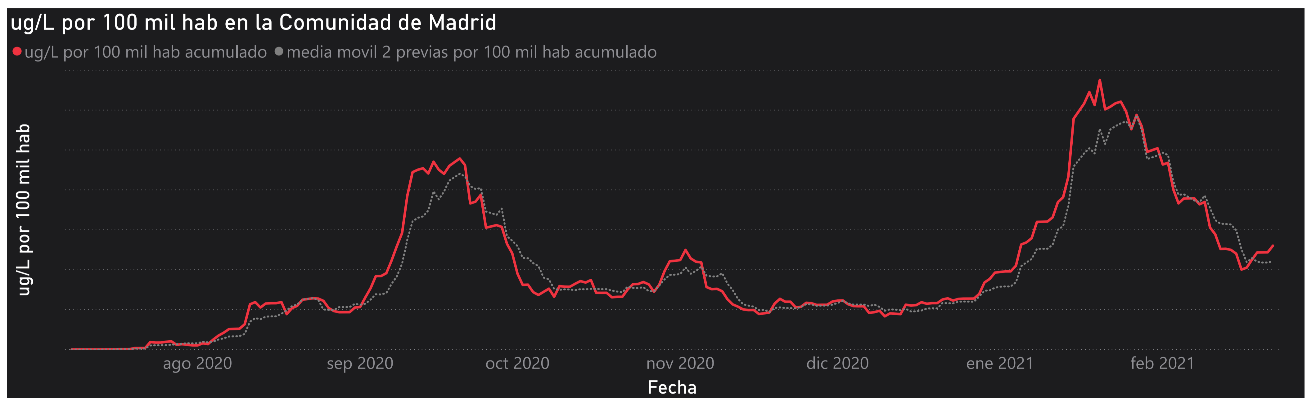
Gráfico 1. Evolución general de la Comunidad de Madrid