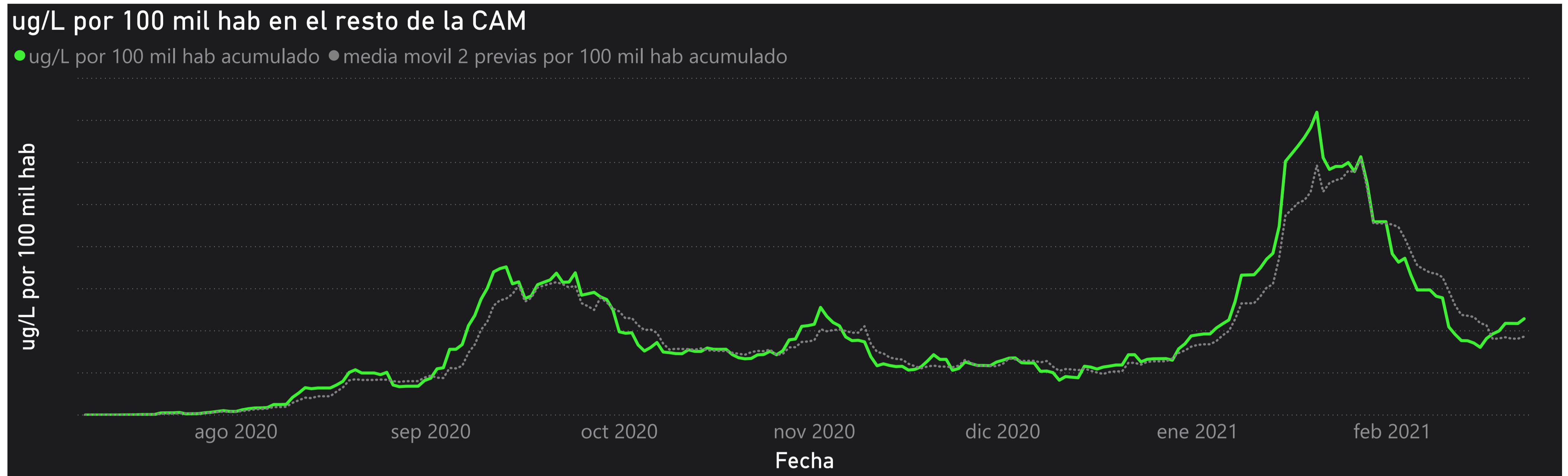
Gráfico 3. Evolución general de la Comunidad de Madrid, excluyendo la capital